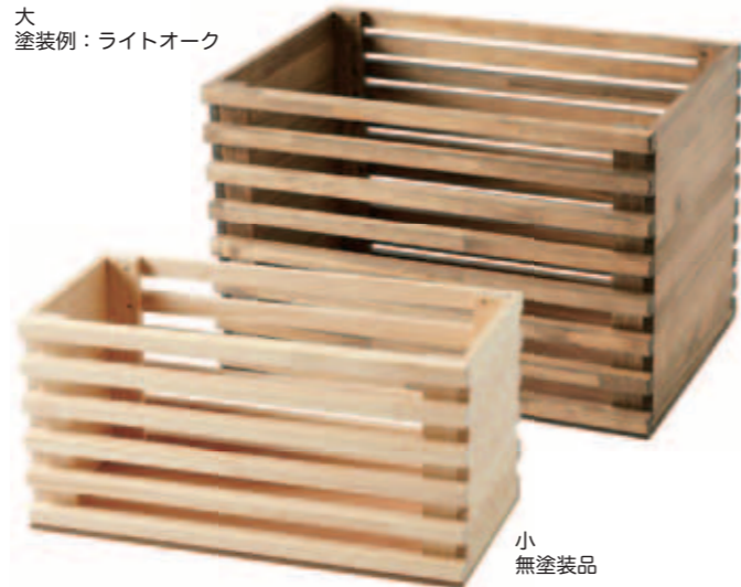
大 塗装例：ライトオーク