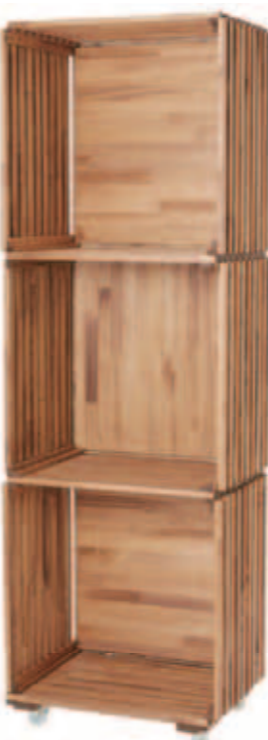
<組み合わせ例> 塗装例：ブラウン ■BOX本体×3台 ■専用台車×1台

MAEDA CRAFTのほぼすべての木製品は、別注対応可能です。各種制限や条件など、詳細はお問合せください。