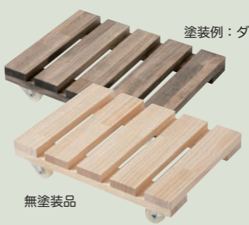
塗装例: ダークオーク

パレット台車 大は、 ビールケースが ちょうど載るサイズです。 マルシェ木箱にも 対応しています!