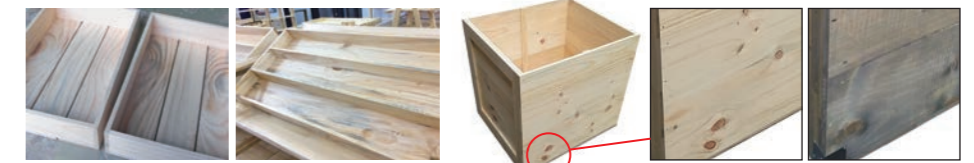
ブルステイン（無塗装） ブルステイン（クリア） 節（無塗装） 節（ライトオーク） ライトオーク塗装ではブルステインはほとんど見えなくなります。